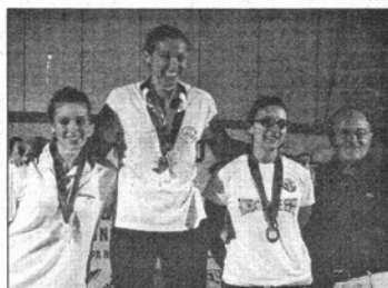
Secondo posto per Over Mas Brescia e terza piazza per i portacolori dell'Eurobody. Nelle foto, tutti i protagonisti della serata tenuta a Rosolina Mare sabato. Una buona cornice di pubblico ha assistito alle sfide delle gare valevoli per i campionati italiani